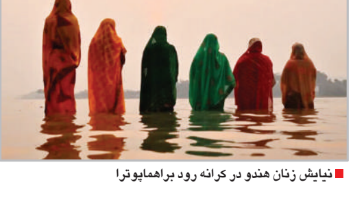
نمایش زنان هندو در کرانه رود برهماپوترا