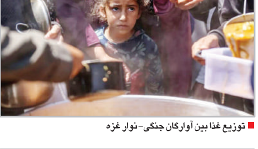
توزیع غذای بین آوارگان جنگی - نوار غزه