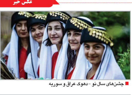
جشن‌های سال نو - دهوک عراق و سوریه