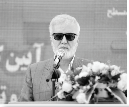
عضو و ناظر شورا در منطقه هفت شهرداری شیراز: