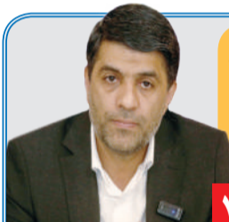
مدیرکل میراث فرهنگی، گردشگری و صنایع دستی استان فارس تشریح کرد:

آماده‌سازی پرونده ثبت جهانی محور زندیه در شیراز