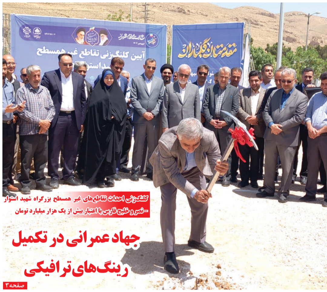
تنگ‌بونی احداث تقاطع‌های غیر همسطح بزرگراه شهید استوار کشور و خلیج فارس با اعتبار بیش از یک هزار میلیارد تومان

مهار و بهره‌برداری از سیل یکی از سیاست‌های اصلی آبخیزداری در کشور است و امید می‌رود علاوه بر هشدارهای رنگی به مردم و کشاورزان مسئولان نیز نسبت به این هشدارها واقعی نهند.