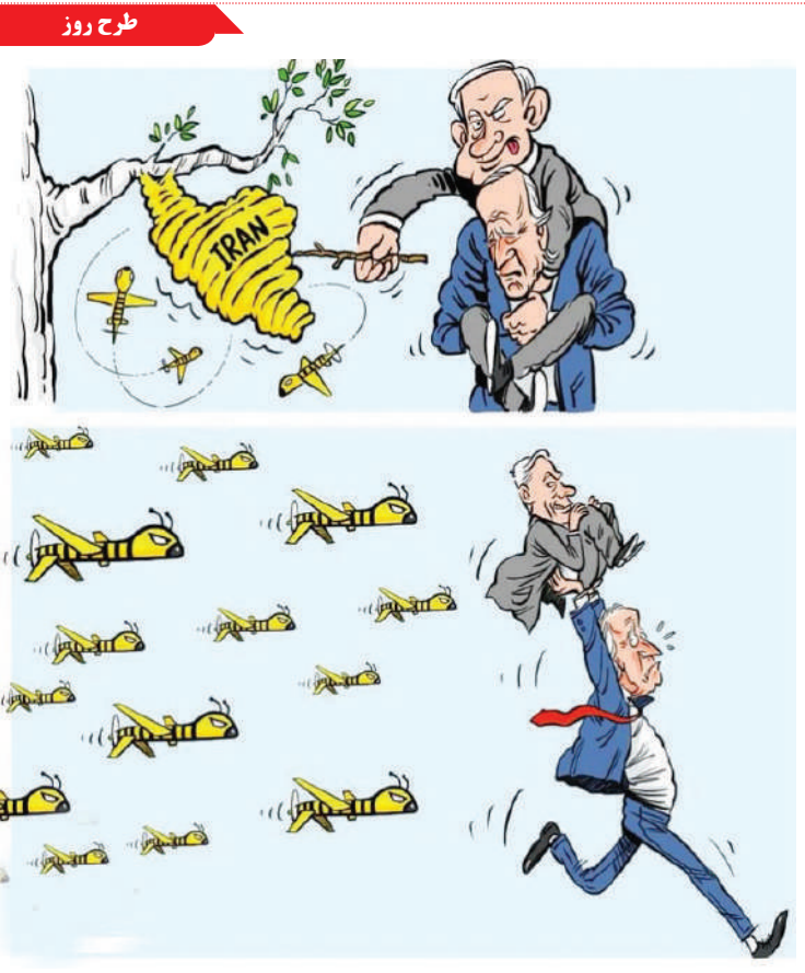
عاقبت طمع به لانه زنبور

چرا در دیدارهای خانوادگی عصبی هستیم؟ اگر فرد به ویژه در رویدادهای اجتماعی بزرگ، به شدت احساس اضطراب، استرس یا ناراحتی می‌کند، این اختلالی است که در آن تعامل با دیگران اجتناب می‌کند. ممکن است علائم اضطراب مانند: افزایش ضربان قلب، تعرق مفرط، تنفس دشوار، احساس تهوع یا استفراغ، اسهال و ناراحتی معده و فشارعضلانی داشته باشند. چگونه با مشکل درست برخورد کنیم؟ خودتان را در تنگنا قرار ندهید زیرا در رفتن به رویداد خانوادگی راضی نیستید. مضافاً اینکه مهم است به یاد داشته باشید که به آنها اهمیت می‌دهید و دوست دارید، اما احساسات پیچیده‌ای نیز دارید. لازم است درک کنید که این احساسات طبیعی هستند، زیرا لزوماً همه افراد احساس نزدیکی و آشنایی کامل با نزدیکان خود ندارند و این بدان معنا نیست که شما از مشکلی رنج می‌برید یا خانواده شما نیز از مشکل خاصی رنج می‌برند. پس از آن، باید آگاهانه با مشکل برخورد کنید تا زندگی‌تان را درگیر نکند، به شرح زیر: قبل از حضور در جمع خانوادگی برنامه‌ریزی کنید: یکی از بهترین راهکارها برای مقابله با اختلال اضطراب اجتماعی در جمع‌های خانوادگی، داشتن برنامه است. این کار با تهیه لیستی از اشیاء و افرادی انجام می‌شود که باید از آنها دوری کنید تا از قرار گرفتن در یک موقعیت ناراحت‌کننده محافظت کنید.