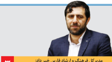
مدیرکل فرهنگ و ارشاد فارس خبر داد: برپایی کنفرانس سرداران شهید در آبان‌ماه

آماده‌سازی پرونده ثبت جهانی محور زندیه در شیراز