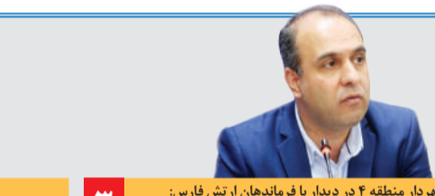
شهردار منطقه ۴ در دیدار با فرماندهان ارتش هشتم قهرمان رشادت‌ها و جانشانی‌های ارتش هشتم