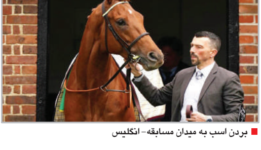
بردن اسب به میدان مسابقه - انگلیس

سواد زندگی زیاد فکر نکنید افرادی که از اضطراب اجتماعی رنج می‌برند، به گونه‌ای به موقعیت فکر می‌کنند که ممکن است ترس آنها را در چندان کند. پس ستاره‌های منفی را در ذهن خود ایجاد نکنید. هر چه مثبت‌تر باشید، بهتر است. مکالمات کوتاه بهترین دوست شامست مکالمات کوتاه ممکن است ناخوشایند باشد، اما در موقعیت‌های اجتماعی، افرادی که دوستان نزدیک شما نیستند، تمرین خوبی است. مکالمات کوتاه راه بسیار خوبی برای آشنایی دوباره با یکی از اعضای خانواده است که مدتی است ندیده‌اید یا فردی که می‌خواهید بیشتر با او آشنا شوید. در مورد چیزهایی که از آنها لذت می‌برید صحبت کنید وقتی در مورد چیزی که از آن لذت می‌برید صحبت می‌کنید، مقابله با اضطراب اجتماعی جمع‌های خانوادگی آسان‌تر می‌شود. این موضوعات می‌تواند همسران یا حتی فیلمی که اخیراً تماشا کرده‌اید، باشد. محدودیت‌های سختی را تعیین کنید بسیاری از ما، اقوام کنجکاپی داریم که سوالات شخصی زیادی از فرد می‌پرسند. موظف نیستید به سوالات او پاسخ دهید. مودبانه کلمه‌ها را به سمت دیگری هدایت کنید یا مودبانه بگویید که ترجیح می‌دهید پاسخ ندهید.