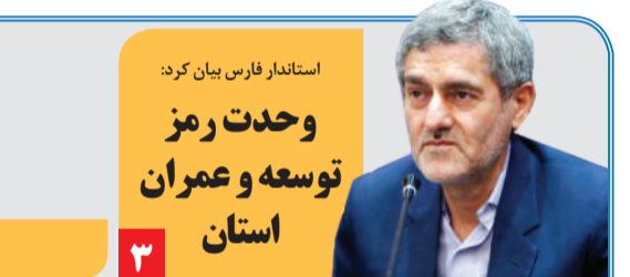
استاندار فارس بیان کرد: وحدت رمز توسعه و عمران استان